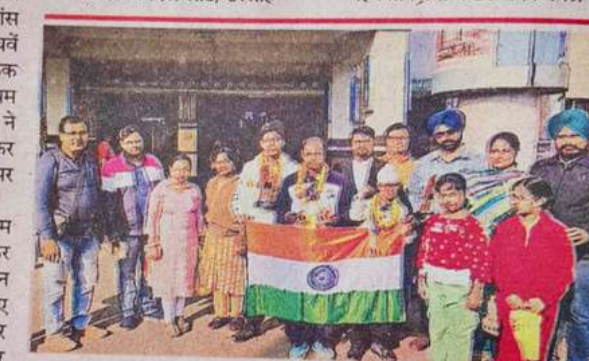
अंतरराष्ट्रीय किक बॉक्सिंग में शानदार प्रदर्शन कर लौटे खिलाड़ी।